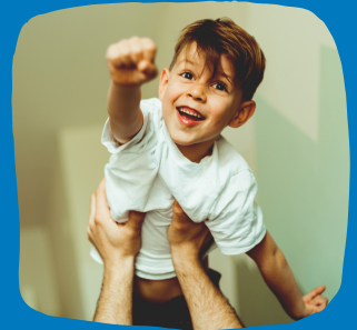
Çocuğun liderliğini takip edin.