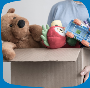
İlgi çekici oyuncaklar bulun.